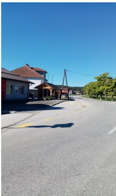
Urejena postaja v Radoslavcih

V sredini vasi Radoslavci, ob gasilskem domu, se nahaja urejena postaja, a učenci imajo le iz enega dela vasi pločnik, iz drugih ga nimajo in poti do poistaje potekajo po glavni (prometni) cesti. Postaja se nahaja v križišču treh glavnih in prometnih cest.