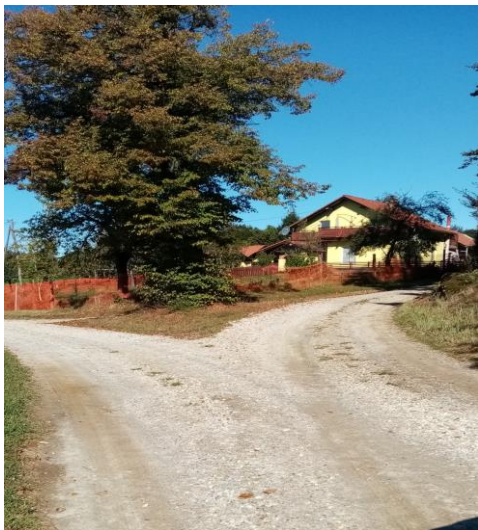
Postaja v Godemarcih (zgoraj)

Na zgornjem delu vasi vstopita dve učenki: ena prihaja po makadamski cesti, druga vstopa ob svojem domu.