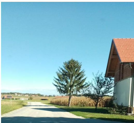
Druga postaja v Radoslavlcih (Farkaš)

Druga postaja je na stransko cesto k domačiji Farkaš: učenci počakajo na stranski cesti in vstopajo in izstopajo v avtobus, ko le ta ustavi. Cesta je pregledna. Učenci gredo domov ali na postajo po glavni cesti, kjer ni pločnika.