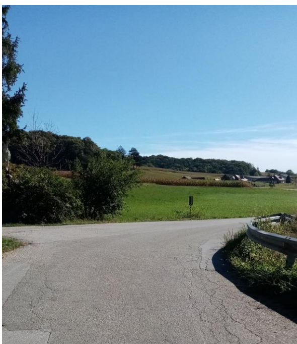
Postaja v Moravcih ob gostilni Med jelšami

Druga postaja v Moravcih je ob križišču stranske ceste in glavne ceste (v bližini gostilne Med jelšami). Učenci vstopajo s stranske ceste, izstopajo pa na drugi strani in morajo prečkati cestišče. Nevarnost predstavlja tudi ovinek, postaja je v ovinku.