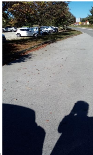
Postaji ob Biotermah

Druga postaja v Moravcih je ob križišču stranske ceste in glavne ceste (v bližini gostilne Med jelšami). Učenci vstopajo s stranske ceste, izstopajo pa na drugi strani in morajo prečkati cestišče. Nevarnost predstavlja tudi ovinek, postaja je v ovinku.