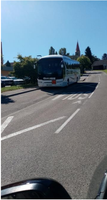
Postaja pred Zavodom Dornava