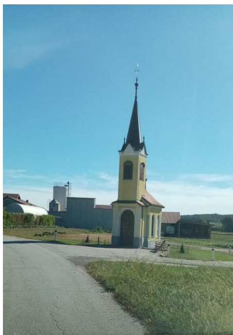
Tretja postaja v Radoslavlcih (Filipič)

Tretja postaja je v Radoslavlcih via Bioterme. Postaja je ob vaški kapeli, kjer učenci čakajo na stranski cesti. To leto prihajajo na postajo učenci le po izstranske ceste, ki ni tako prometno obremenjena.