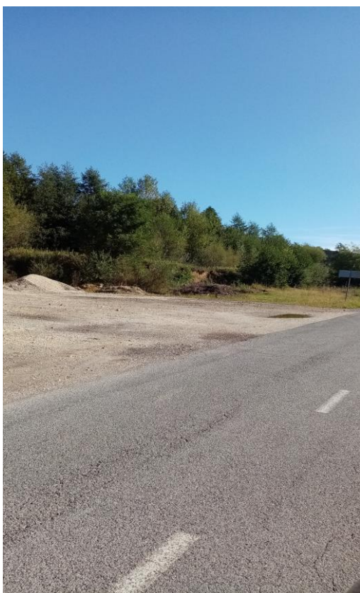
Postaja v Bodislavcih (makadamsko parkirišče)

Prva postaja je v spodnjem delu vasi. Avtobus odpelje z glavne ceste na makadamsko parkirišče. Vstop je varen, odhod domov je po glavni cesti. Izstop iz avtobusa je na stransko cesto.