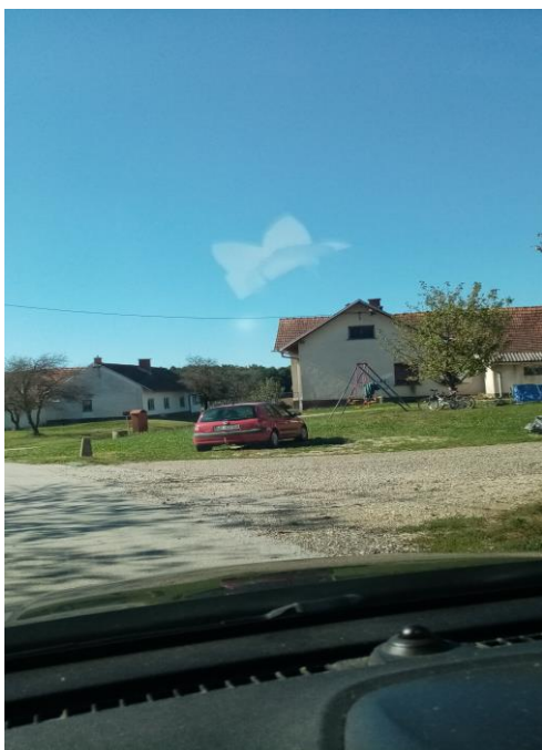
Vstopna postaja pri Zmazkovih v Precetincih