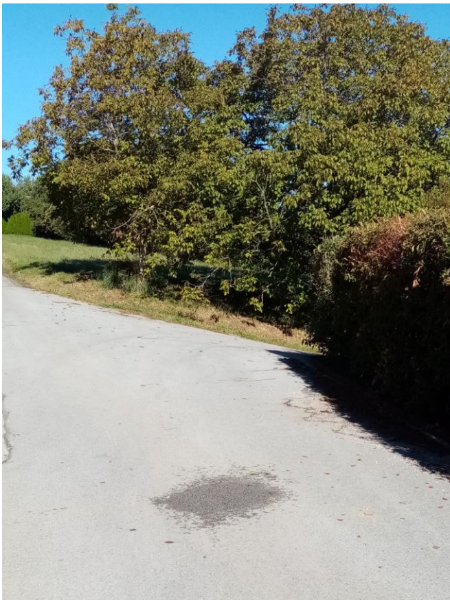
Postaja v Moravcih ( družina) Ritonja

Kombi prihaja tudi po otroke k družini Ritonja, kjer so same stranske ceste. Kombi lahko obrne, otroci vstopajo in izstopajo na stransko cesto.