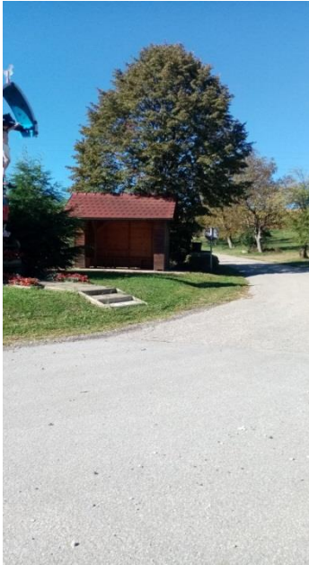
Postaja v Precetincih

Večina otrok pride po različnih stranskih cestah, ki sicer niso prometne, so pa ozke, nepregledne, ovinkaste; hoja po cesti je nevarna, pa tudi postaja je tik ob križišču. Ker na avtobus vstopa veliko število otrok, ki skupaj prihajajo in odhajajo, je potrebno hoditi v koloni le dva po dva.